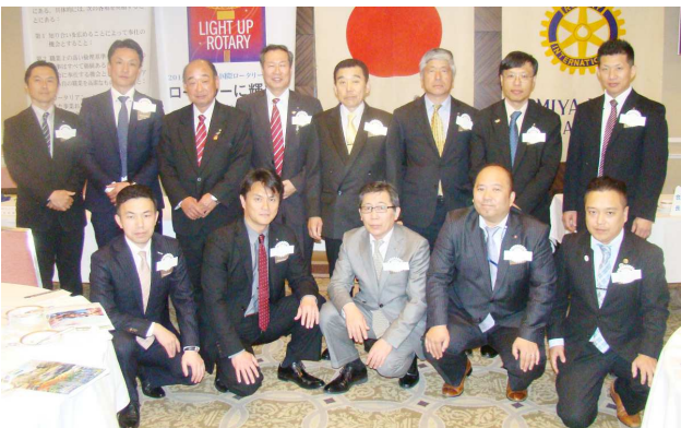
上尾西ロータリークラブの皆様