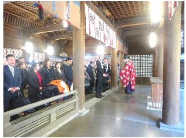
武蔵一宮 氷川神社にてご祈禱していただきました