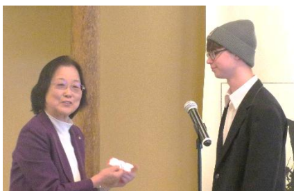
青少年交換学生 お小遣い支給