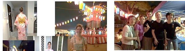
日本の夏といえば盆踊り 日本に来てお祭り三昧でした。