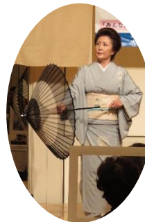
■アトラクション 芸者さんの舞踏