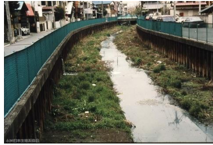
わずかに残った 自然も…