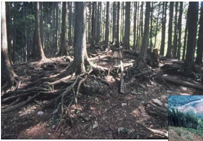
数千年、数万年かかって 作られた土壌