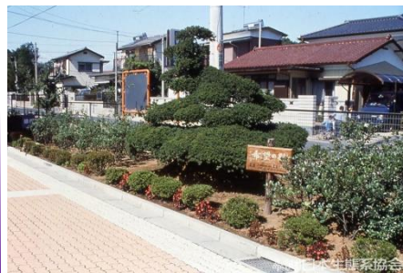
学校などでも、 ツゲの木とい った園芸品種 が