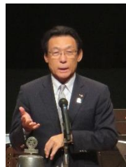
来賓挨拶: ガバナー 梨本 松男