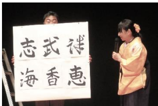
書道部員の書を紹介