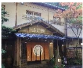
「貴船ふじや」にて昼食