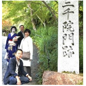
③ 大原三千院宝泉院