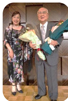
寄せ書きと花束を贈呈